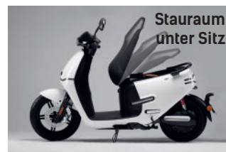
Stauraum unter Sitz